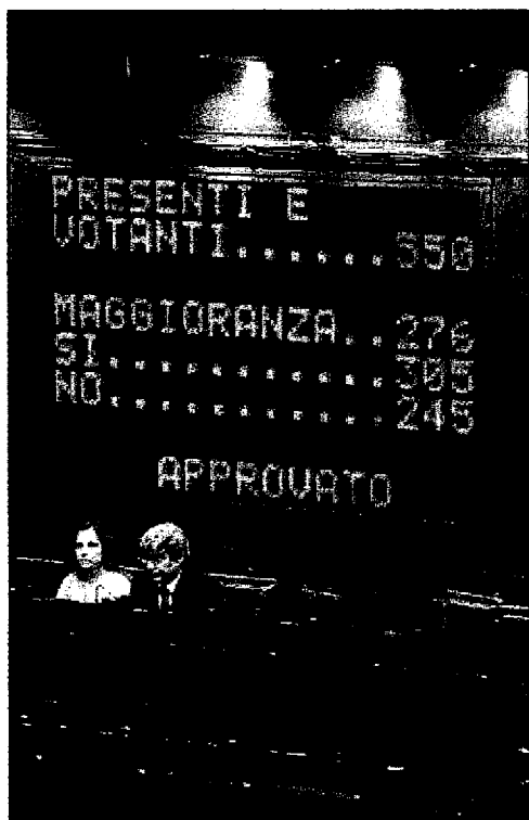
Il voto di fiducia ieri alla Camera