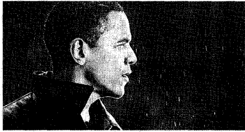
Barack Obama ieri ha festeggiato i primi 100 giorni di presidenza